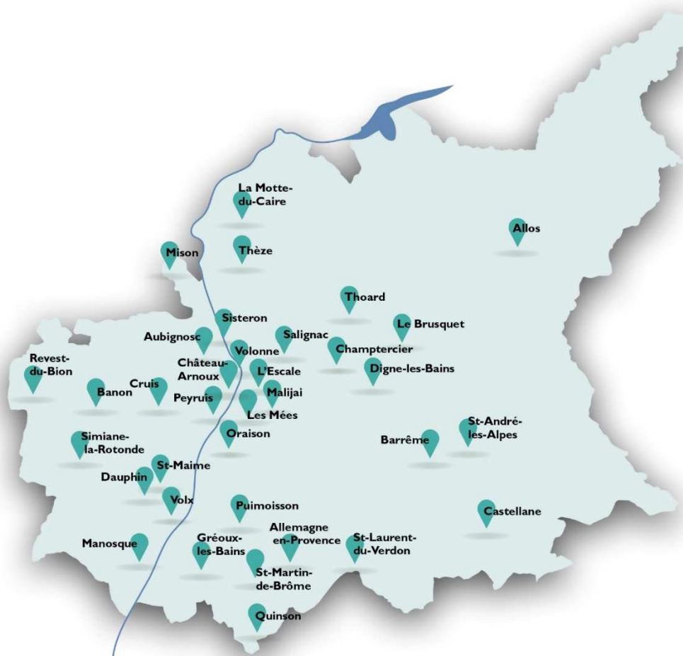
Communes concernées par le rachat de l'emphytéotique

44 communes ont déjà acté la cession auprès d'Habitations Haute Provence. Ce qui représente 1557 logements - soit 77,7% de l'ensemble du projet de rachat de l'emphytéotique.